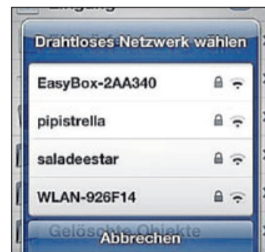
Schnell verbunden: Smartphones zeigen Netzwerke in der direkten Umgebung an.

Das Wort Hacker ist für sie ein neutraler Begriff, der vielfach in negativen Zusammenhängen genutzt werde. Eigentlich bedeute er nichts anderes, als einen kreativen Umgang mit neuen Technologien zu pflegen. (als/bgi)