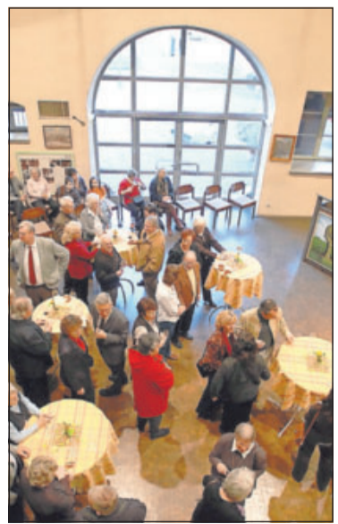
Erste Adresse auch für Auswärtige: der Freinsheimer Von-Busch-Hof (hier bei einem Neujahrsempfang).